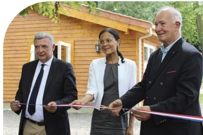
Inauguration le 22 juin 2022 en présence du président du département, de la Préfète déléguée à l'Égalité des Chances et du président de l'association ARILE